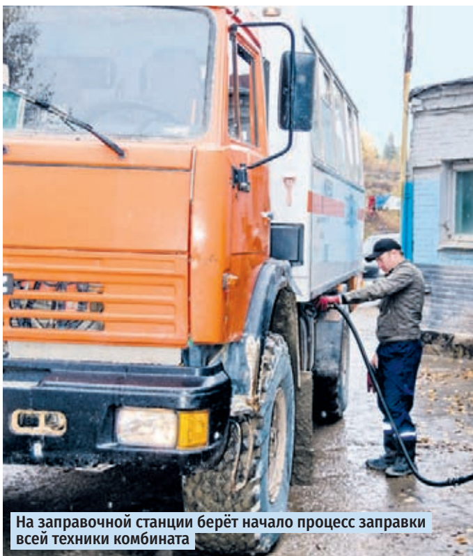
На заправочной станции берёт начало процесс заправки всей техники комбината